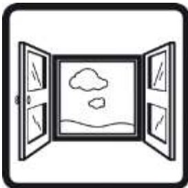
Ventilar a zona de trabalho.

“O efeito mecânico das fibras em contacto com a pele pode causar irritação temporária”