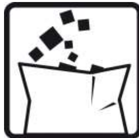
Eliminar os resíduos segundo a regulamentação local.