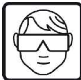
En caso de trabajar por encima de la cabeza, usar gafas protectoras.