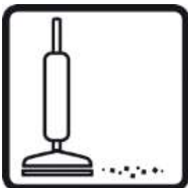
Aspirar la zona