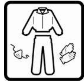
Cubrir la piel expuesta. Usar mascarilla si la zona no está ventilada.