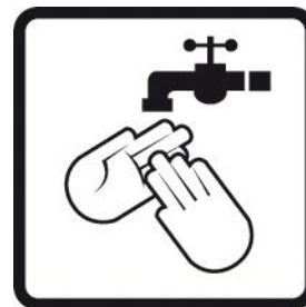
Enjuagar las manos con agua fría antes de lavarlas.