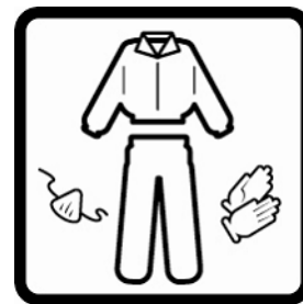
Cubrir la piel expuesta. Usar mascarilla si la zona no está ventilada.