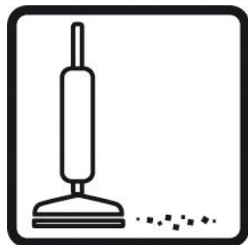
Aspirar la zona