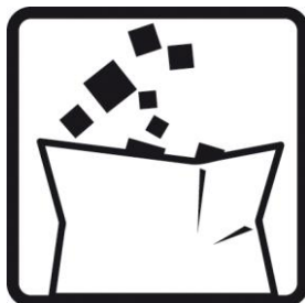
Eliminar os resíduos segundo a regulamentação local.