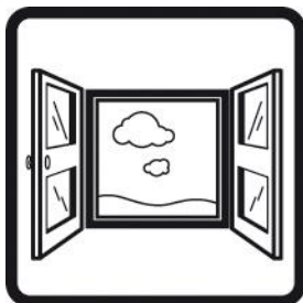
Ventilar a zona de trabalho.

“O efeito mecânico das fibras em contacto com a pele pode causar irritação temporária”